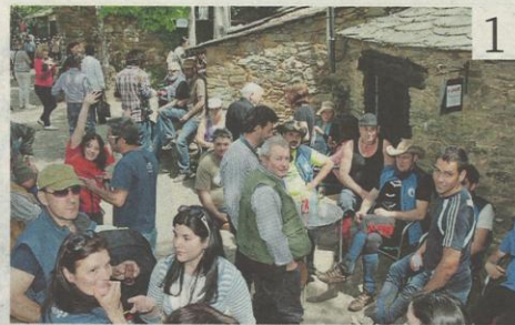
El club ecuestre monfortino acudió otro año a Vilachá. ROÍ FERNÁNDEZ