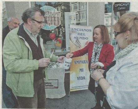
Ancianos del Mundo recaudó fondos el Día de la Madre. A. LÓPEZ