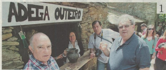
Todas las bodegas centenarias abren el primer fin de semana de mayo por la feria. ROÍ FERNÁNDEZ